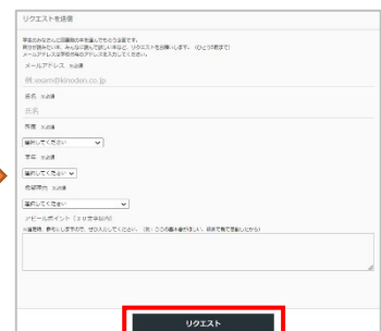
③必要事項を入力後、「リクエスト」をクリック

問い合わせ先：東北文化学園大学 総合情報センター図書館 TEL 022-233-3878 メール lib02@office.tbgu.ac.jp ※電話、メールでのリクエスト受付はしておりません。