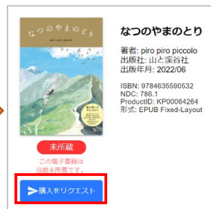
②欲しい本の「購入リクエスト」をクリック