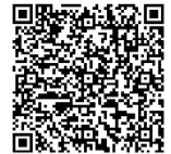
リクエストフォーム URL